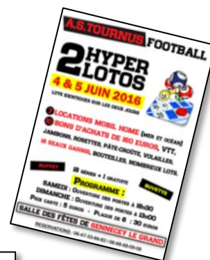
EXEMPLES DE QUELQUES MANIFESTATIONS

L'événementiel est un point important pour le club avec de nombreuses manifestations sportives et extra sportives organisées tout au long de l'année. La réalisation des manifestations sportives et extra sportives est une obligation pour notre club afin d'assurer des fonds financiers permettant aux sportifs d'évoluer dans les meilleures conditions possibles.